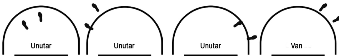
Dijagram 4. Položaj igrača unutar/van polja polukruga bez probijanja

Tumačenje: Ovo je pravilna igra igrača A1. Primenjuje se pravilo o polukrugu bez probijanja.