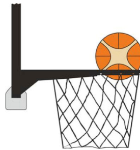
Dijagram 3. Lopta je unutar koša

31-20 Iskaz. Prekršaj ometanja nastaje ako igrač odbrane dodirne loptu dok je ona unutar koša.