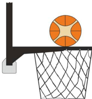
Dijagram 2. Lopta dodiruje obruč

31-15 Iskaz. U toku šuta na koš iz igre, igrač odbrane ili napada je načinio prekršaj ometanja kada dodirne koš ili tablu dok je lopta u dodiru sa obručem i još ima šansu da uđe u koš.